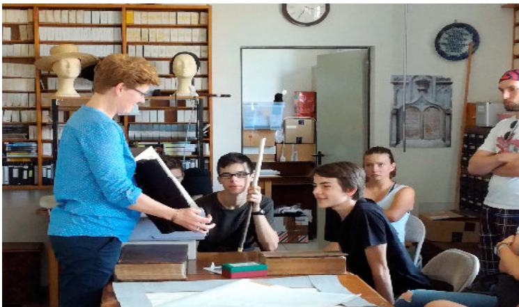
Besuch in der Forschungsstelle Weierhof